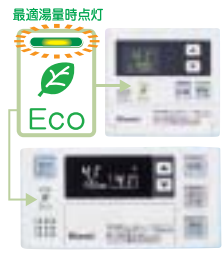
■ECOシグナルリモコン