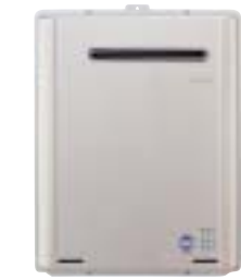
■本体/RUF-E2400AW 24号全自動給湯付風呂釜

RUF-EとECOシグナルリモコンを併用すると、従来のガスふろ給湯器と比べてとっても省エネ。