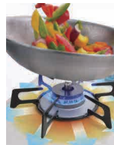
〈ヒートオフガラスストップ〉