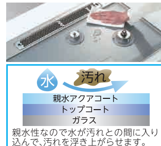
〈親水性コートガラスストップ〉