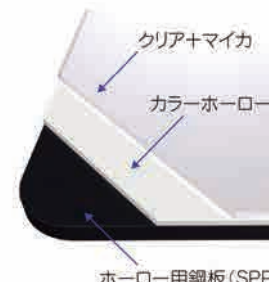
〈ホーロー+ガラスコートの一例です〉 フェアリーピンク