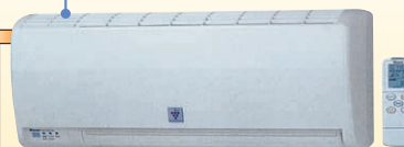
リンナイRH-61W(A)+RBH-W414KP 定価 205,524円