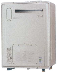
リンナイ RVD-E2405SAW2-1 (A)