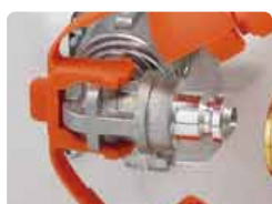
ガスファンヒーター等