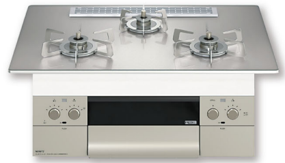
NORITZ Orche (オルシェ)